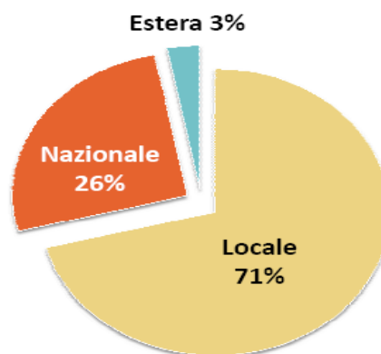
Provenienza geografica degli approvvigionamenti